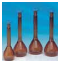
带聚丙烯塞子 A 级棕色容量瓶