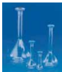
带聚丙烯塞子 A 级透明容量瓶